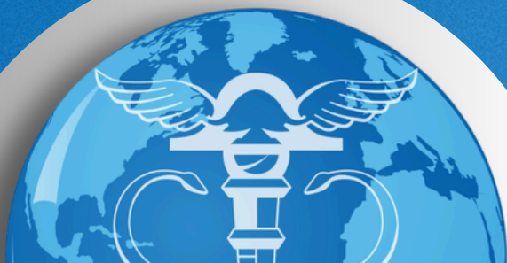
TABELA DE REFERÊNCIA 02º TRIMESTRE 2026