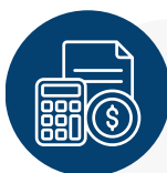
TABELA DE REFERÊNCIA DE CÁLCULOS

Pela média de demanda de mão de obra em cada tipo de operação. Para proposta formal avaliaremos a real demanda do negócio, para ajustes de custos à realidade da empresa.